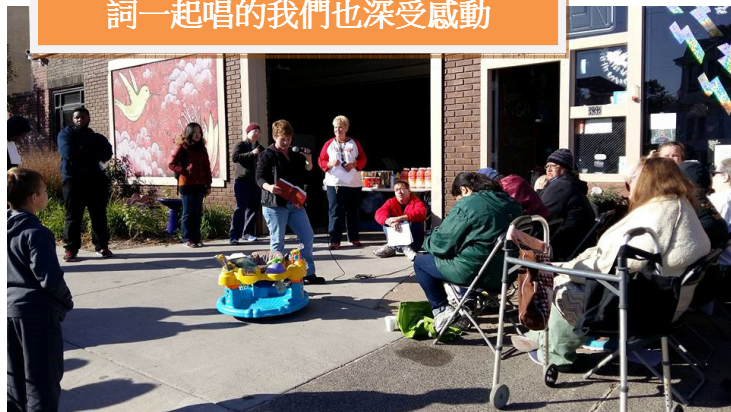
教社區民眾唱聖歌的志工，跟著歌詞一起唱的我們也深受感動

期中考完的五天，我們去了一趟由學校老師舉辦的 Urban Plunge。那主要的內容是帶我們參觀一些收容所、感化中心以及拜訪其他無家可歸的遊民，這趟旅行讓我受益良多，因為這是我第一次主動去關懷我平常忽略的人們。我們彼此對話、聆聽每個人的人生經歷，那之中有起伏及轉折，有徬徨也有堅強。藉由志工工作幫助有需要的人這件事，我深刻體會並參與了一部分他們的人生，成了他們短暫的聽眾。而我也明白這世界之所以令人感動，是因為每天有不同的人在努力活著，找尋著自己的人生意義。