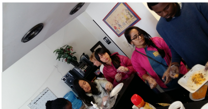
大家一起分工手做早餐 Burrito 給社區民眾品嚐

Club。光是上個學期，我們就舉辦了不少活動，像是卡拉ok之夜以及 International Taste Night 等等。我們嘗到了來自不同國家的特色料理，我們也將台灣的炒飯及珍珠奶茶發揚光大，讓許多外國朋友得以嘗鮮。種種異國料理中，我最喜歡日本教授——Togashi 分享的咖哩飯，那是又甜又道地的美味。我想在所有教授之中，Togashi 老師是最照顧我的長輩，除了課堂上的交流外，課外時與老師的互動也像是朋友般。比如說萬聖節時，老師聽到我們沒有帶台灣傳統服飾來美國，便主動提議出借之前台灣朋友送她的旗袍給我們，讓我們能更融入節日氣氛；不只是咖哩飯，老師也會常常分享日本的小點心給我們品嚐，甚至還邀請我們到他學校宿舍吃飯，我想老師的日本料理也是此趟交換經驗中最讓我難以忘懷的事物之一吧。