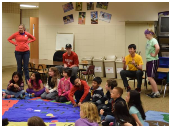
在 Buenafiction Day 到附近小學服務。

浴巾、毛巾與洗衣籃，所以這部份不用太擔心，而且因為我是在下學期交換的學生，我剛好有同學在那裏交換，所以我詢問他們是否可以留下其他比較重的日常用品給我，這樣不僅可以省錢還可以多裝一些自己的行李。更多的是在布納維斯塔大學交換其實花不到太多食物費或娛樂費，其一是因為那裡比較鄉村，可以去的地方沒有非常多，再來就是因為我自己想要為之後學期結束後的旅行省多一些錢，所以我就限制自己不要浪費太多在不需要的地方上。所以這樣結算下來，如果沒有加上旅遊費的話，基本的費用大約是台幣 22 萬就能解決一切了。