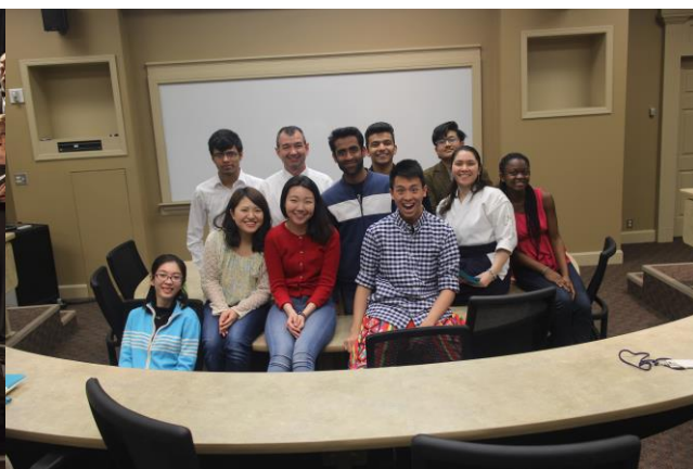
與這學期所有新進的國際生在最後一堂課合照。