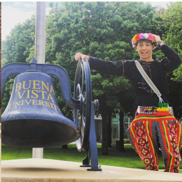
我穿著整套的原住民傳統服裝在校園走動一整天，並與 BVU 的鐘一起合照。