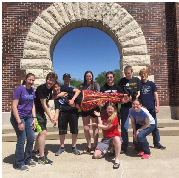
我在 BVU 所交到最好的朋友們，我們在最後一天一起在 BVU 拱門前拍團體照。

就像一場夢一樣，這段旅程終有結束的時候，可能很難再回到一樣的地方再回憶同樣的事，但這段記憶是沒有人可以奪去的，我很感謝我有這個機會離開台灣到一個完全不熟悉的地方去學習很多不同的事，認識到自己成長了多少，雖然有很多人會羨慕出國的人，但在台灣還是有很多地方及資源是可以利用的，千萬不要覺得沒有什麼而忽視它的未來性。最後，我會繼續存錢，希望未來有一天可以再次回到美國，再次回憶這次的經驗。