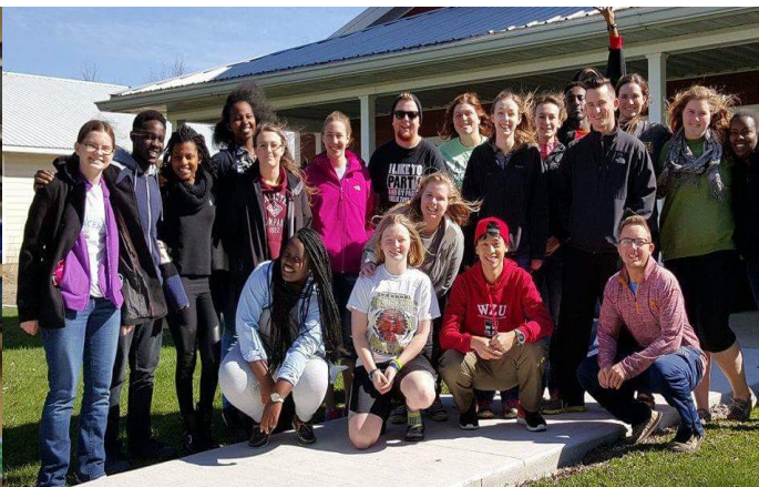
我們到一個營地開始一個周末的 Retreat。