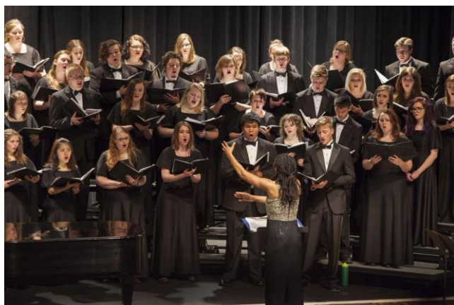
參與合唱團與他們在一起表演。

另外 BVU 有提供一堂美國文化課給來自世界各地的交換生，這堂課的目的是讓國際生有更多機會可以走出校園，了解認識更多美國的特色。在這堂課中，老師每個禮拜都會安排一次的校外教學，目的是讓我們學習很多課本上不會出現的事，然後美國人的六大價值觀是如何被運用在生活中的。在這堂課之後，我發現我以前不正確的刻板印象就因為老師的教學和戶外教學而被大大的改變了！然後我還有選修一堂心理學，這堂課一開始會覺得很難，但只要你提前預習與課後複習的話，就可以在上課時不會聽得一頭霧水，而且考試的時候也可以正常應付。最後是我在 BVU 最喜歡的一堂課 - concert choir(合唱團)，在這堂課中會加入原有的合唱團團員，每天一個小時的練習就是為了學期末表演最好的給大家看。其實我原本沒有打算加入合唱團，但因為我在新生訓練的時候認識一個日本交換生，我們聊天後發現彼此都很喜歡唱歌，所以她就邀請我跟她一起加入合唱團，也就因此促成這段機會，讓我認識到 BVU 最好的一堂課。雖然每天只有一小時的課程練習，但在其中教授會用很多很厲害的技巧與經驗來讓我們了解怎樣才能唱好一首歌，甚至是一小節的節奏，而且我也很喜歡唱歌，藉此我也可以發現我其實很多時候不是用正確的方式發聲。甚至在學期末，我也跟著他們一起站在 BVU 其中之一最大的舞台上跟著各種很厲害的人一起唱歌，這種感覺真的很有成就感，另外這堂課也是我認識最多朋友的一堂課，他們不但很友善，而且我們都因為有著相同興趣而在同一堂課切磋學習，我覺得這種感覺是真的沒辦法在其他地方得到的。