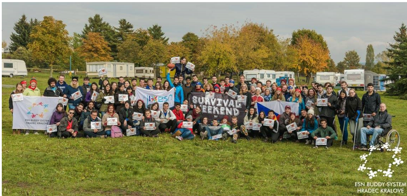
↑ (第十六屆的 Survival Weekend)