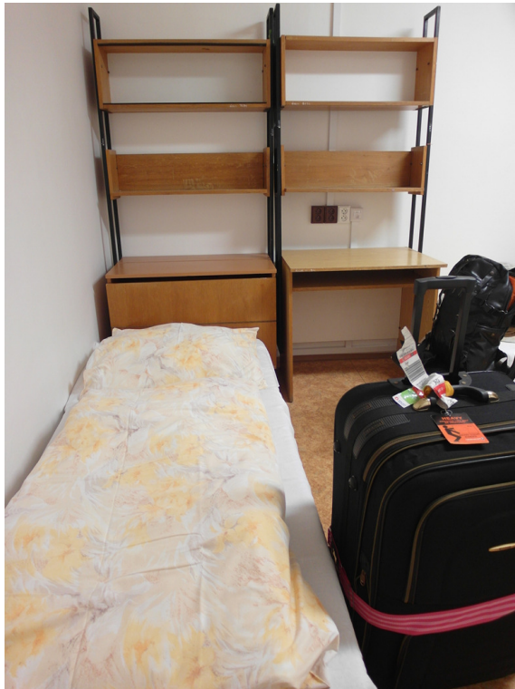
←(抵達宿舍後的房間床位)