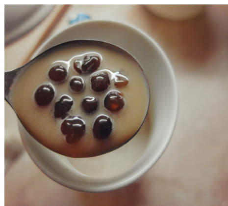
↑ (我和朋友一起準備珍珠奶茶)