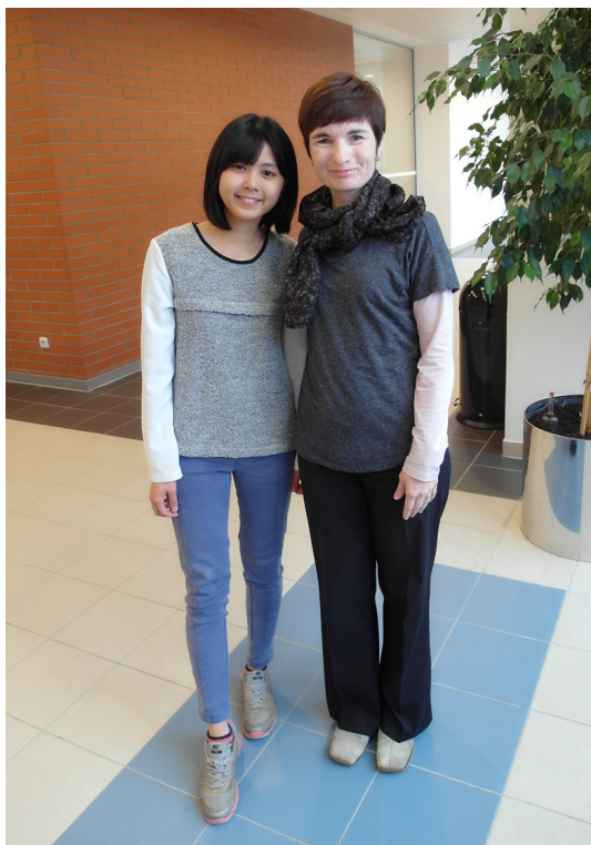
↑(我與我親切又可愛的捷克文課老師)