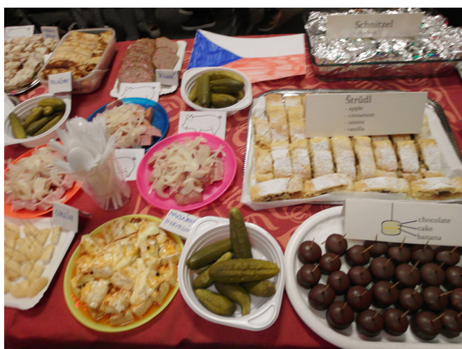
← (International Dinner 當天)