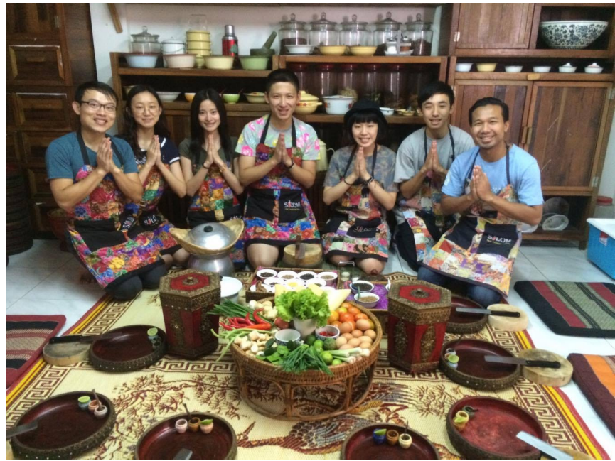
參加泰式料理課程