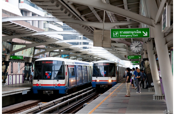
曼谷 BTS 番功夫，還未

剛來到曼谷時，有長期住在泰國的朋友幫忙安排住處、購買日用品、提供生活資訊，所以很快能適應環境，唯一不能適應的是當地人說話的口音。當然地，在泰國主要以泰文為主，餐廳、店家服務人員雖然能夠說點英文，但對話時夾雜著泰文及極重口音的英文，讓我幾乎很難與他們溝通，常常吃飯點餐就要費很大一